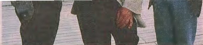
Nick Mason, David Gilmour e Richard Wright, scomparso nel 2008

Rick Tra musica improvvi- qualcosa di scritto, hanno nato i momenti migliori, qualche chitarra e alcu- ce di batteria e messo in- un album fatto da 18 brani quattro lunghe sinfonie, trumentali tranne quel Than Words che passa radio dal 10 ottobre con il Polly Samson, la moglie our. «C'è molta gente — lui — che ama re la musica co- insieme, entrare od. Questo è per n album dunque nbra dire: «Dove o rimasti?». Tan- la prima traccia a Things Left Un-