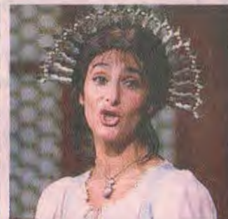
Anna Marchesini nei panni di Lucla