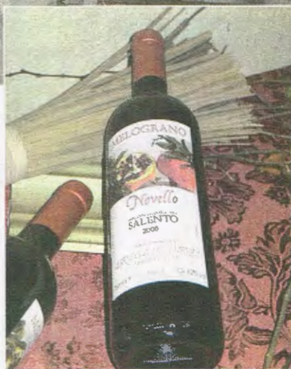
NELLE FOTO: momenti della scorsa manifestazione.