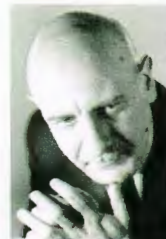
Il maestro Cappello

Torna ancora una volta nella sua terra il grande pianista salentino Roberto Cappello (è nato a Campi Salentina), per il cartellone di "Brindisi Classica". Vincitore di numerosi concorsi pianistici, Cappello viene consacrato dal primo premio al prestigioso concorso internazionale "Ferruccio Busoni" di Bolzano nel 1976 e da allora è riconosciuto come uno dei maggiori esponenti del pianismo mondiale. Costantemente invitato ad eseguire concerti con le più importanti orchestre sinfoniche italiane e straniere, è ospite regolare delle maggiori istituzioni nazionali e internazionali e dei più prestigiosi festival internazionali. Nel suo recital a Brindisi il grande pianista rende omaggio a Schumann e Chopin nel bicentenario della nascita. Salone della Provincia, ore 20.30. Biglietti: intero 10 euro, ridotto 7 euro. Info: 0831/581949, 328/8440033.